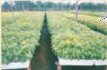
Sistema de producción Copper Block

La labor de PHC no termina con la entrega de su línea de inoculantes y productos biológicos, sino que incluye la asesoría a sus clientes, impartiendo cursos de capacitación en Tecnología Microbiana, así como una línea telefónica sin costo para consultas técnicas. Esto garantiza una mayor efectividad de los mismos y evita aplicaciones inadecuadas para lograr un alto porcentaje de sobrevivencia en los trasplantes y plantaciones forestales de calidad.