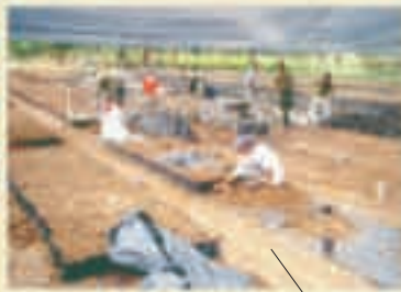
Sistema de producción tradicional