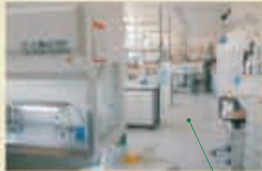
Laboratorio de selección y control de calidad de Plant Health Care en Viena, Austria.