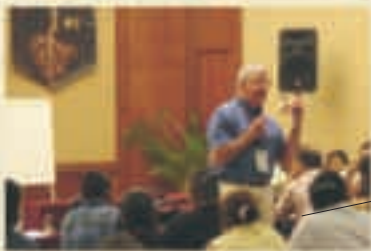
Curso de capacitación sobre Tecnología Microbiana PHC al personal de CONAFOR