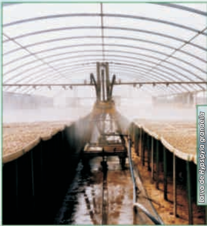
Larva de Hypsipyla grandella